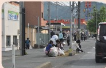
親子ふれあいクリーン作戦 (自治部会)