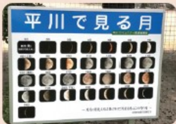
月の看板 (総務・生活環境部会)